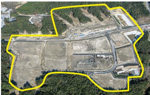
【南産業団地】企業進出状況